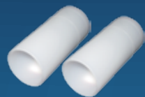
náustek plastový dezinfikovatelný