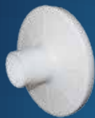
antibakteriální filtr jednorázový