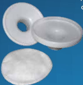
antibakteriální filtr dezinfikovatelný s výměnnou vložkou