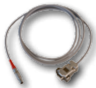
Kabel komunikační SCANLIGHT