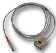
Kabel komunikační SCANLIGHT